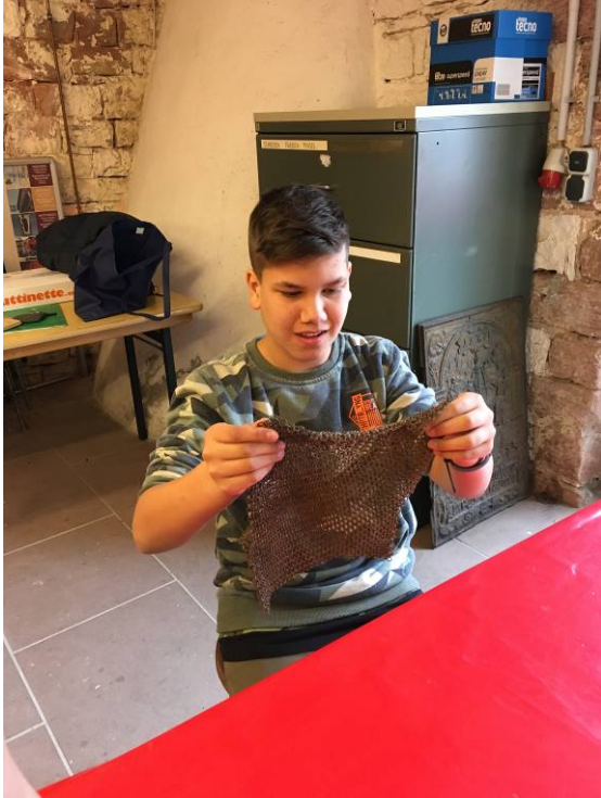
Das ist ein Teil eines Kettenhemdes, das ein römischer Legionär getragen hat.